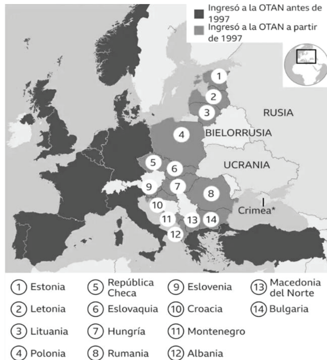
FIGURA 1. Expansión de la OTAN desde 1997

Este tipo de preguntas, se hizo la Federación Rusa cuando se disolvió la URSS y buscaban redefinirse como un nuevo país en un nuevo orden mundial. Ya que, se enfrentaba un periodo de inestabilidad y había perdido una parte de su territorio con la independencia de las ex repúblicas soviéticas.